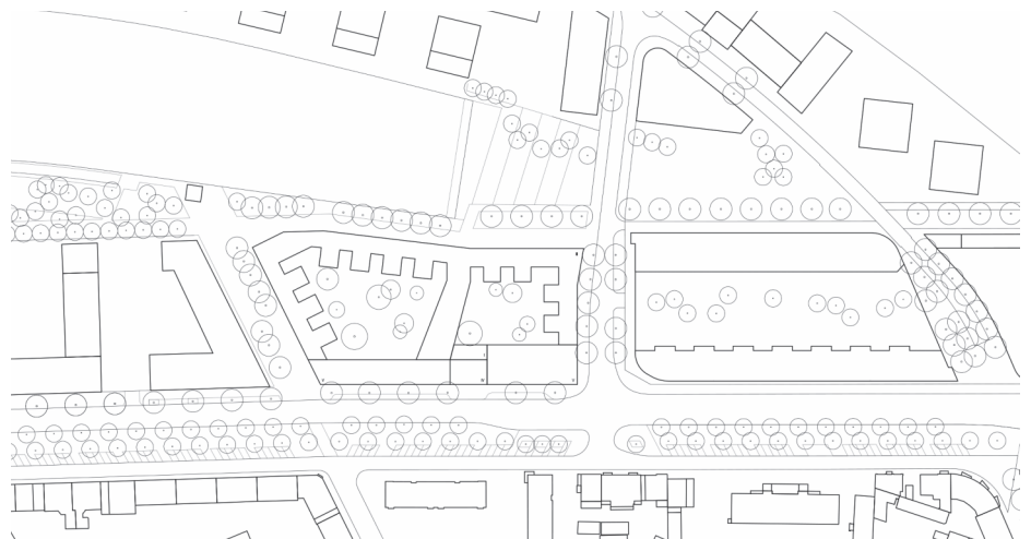
Realisierungsplan M. 1:3.500