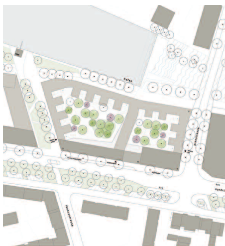
Wettbewerbslageplan M. 1:3.500

Wettbewerbsdokumentation siehe wa 10/2011 Platzierung des Wettbewerbsentwurfes 1. Preis Planungsbeginn 2014 Bau ab 06/2015 Fertigstellung 08/2017 Brutto-Rauminhalt (BRI) 45.794 m 3 Hauptnutzfläche (HNF) 10.748 m 2 Kosten gesamt (brutto) € 26,6 Mio.